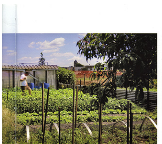
les pouces verts et l'été est déjà là...