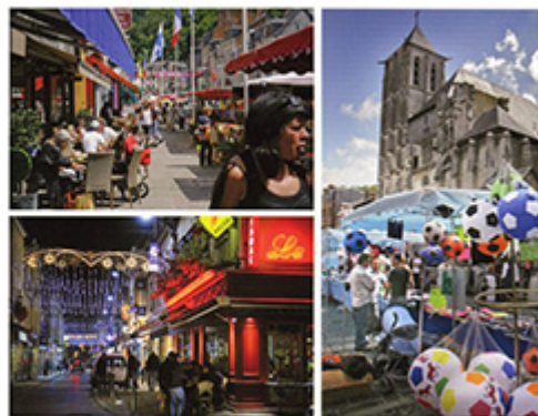
ouverture au fenêtré une verticale perdue dans l'horizon