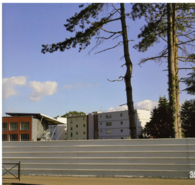
par dessus la barrière