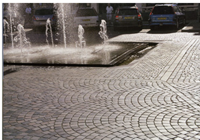
similitude de rythmes