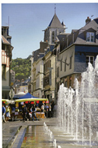
14 eaux vives La ville au rythme de l'eau...