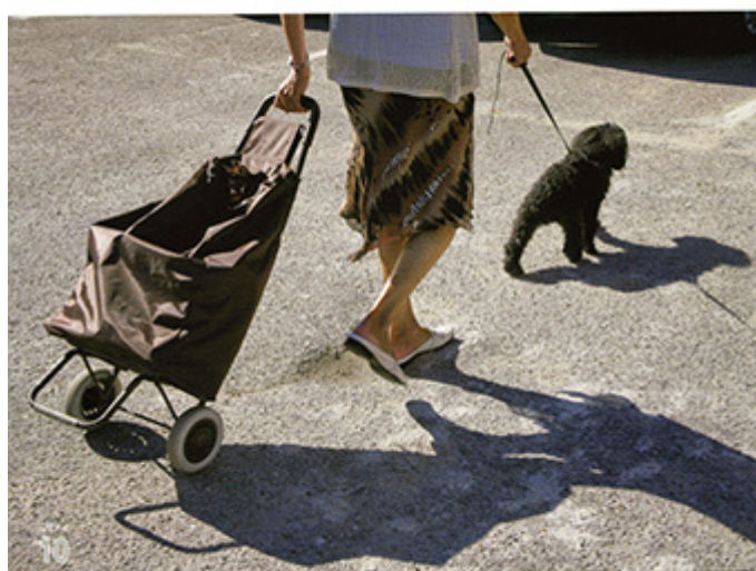
10 jour et nuit moments de calme... gris ou coloré... d'une ou nocturne